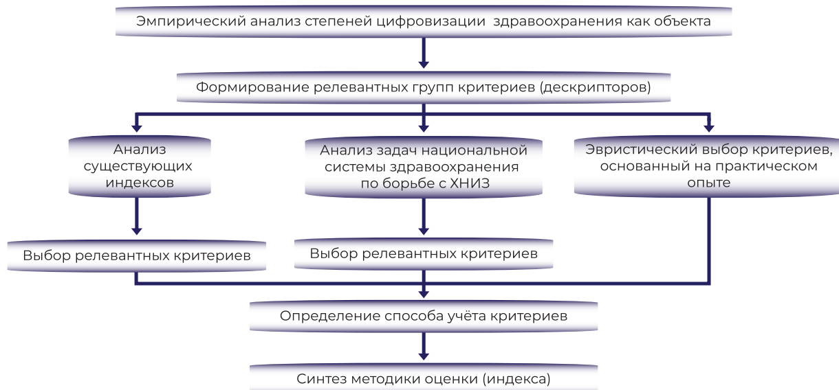
Рисунок 1 — Схема этапов разработки оригинального индекса цифровой зрелости системы здравоохранения.

Надежность разработанного индекса оценена путем вычисления стандартного коэффициента внутренней согласованности альфа Cronbach с использованием массива заполненных на предыдущем этапе анкет ( n = 11 ).